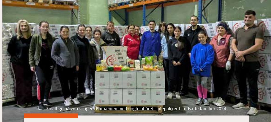
Frivillige på vores lager i Rumænien med nogle af årets julepakker til udsatte familier 2024.

Tallene er fra vores respons til alle feltlande i 2024